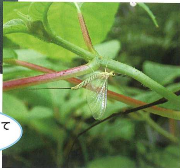
川での幼虫期を終えて羽化したカゲロウ