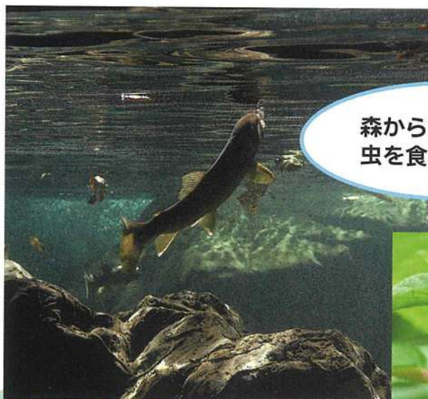
森から落ちてきた虫を食べるイワナ