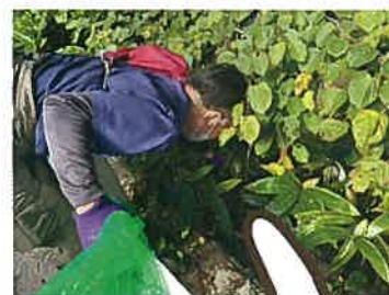
こんな草の中まで ゴミを拾ったよ!!