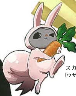
スカイクン (ウサギVer.)