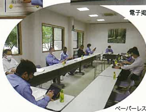
ペーパーレス会議

紙を使っていた社内での連絡事項の伝達や会議資料の配布を、電子掲示板の使用や、タブレットへの電子ファイル送信に変えています。紙の使用量を削減し、ごみの削減にも繋がっています。