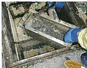
汚水や汚泥をバキューム車で引き抜き、ブラシで掃除します。