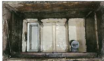
掃除でスッキリきれいに！ (作業の際、お湯などをお借りする事がございます)