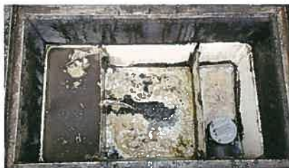
油と汚泥でこんな状態になっています。