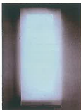
①ロールカーテンのある窓

下の図はロールカーテンのある窓の状況を写したものです。①は普通に写した窓です。これを赤外線放射カメラで見えます。②はロールカーテンを上げた状況です。壁面は16℃前後ですが、ガラス部分は11℃前後と約5度の差があります。一方、③はロールカーテンを下げた状況です。カーテンの表面温度は壁面とそれほど差がありません。カーテンをしていると、これだけ保温効果があることがわかります。