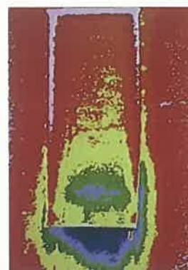
③ロールカーテンを下げた場合

ただ、③でも、窓の下側とその下の壁面は温度が低くなっています。これは、ロールカーテンと窓枠との間に隙間があるため、冷気がその隙間から流れ込むのです。より保温効果を高くするためには、カーテンを窓より長めにして、隙間をなくすことが大切といえます。その他にも窓下に冷気が溜まる場所を作ることも対策になるようです。ちょっとした工夫で、少しでも快適な暮らしができればいいですね。